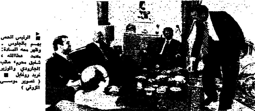
الرئيس المص يستمع من كورنا الديمقراطية